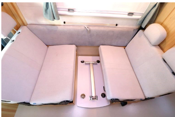
テーブルは座席の間に置けます。