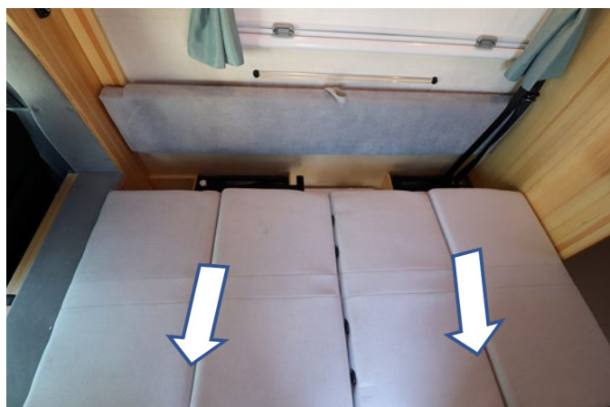
足元のロックを解除し通路側にスライドします。