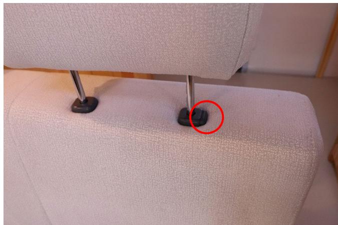
ロックを解除しヘッドレストを外します。