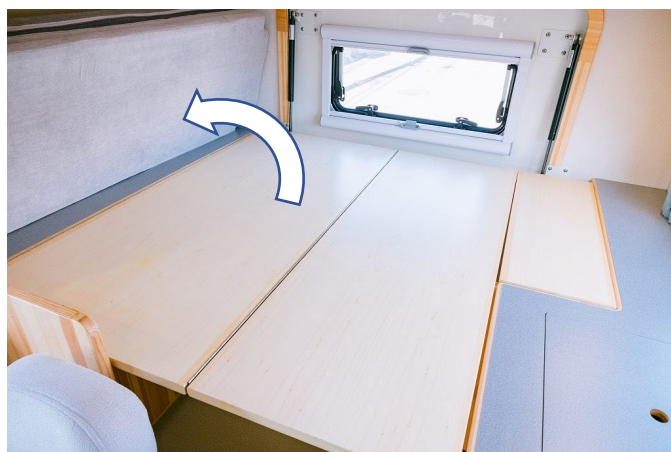
マットは折りたたんで図の位置に収めます。