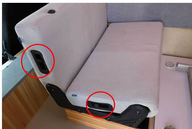
座席脇のロックを解除すると座面、背もたれが動きます。