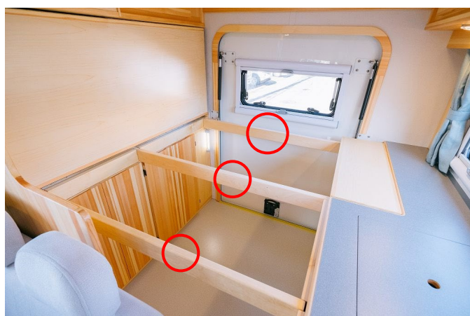
支えの棒をはずしてマットと一緒に収納します。