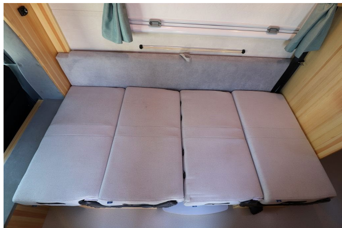
平にして1人分のベッドの完成。