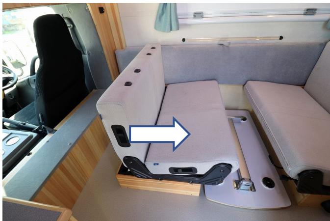
足元のレバーでロックを解除し後ろに動かします。