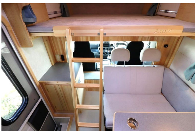
上り下りははしごをご利用ください