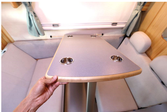
テーブルの手前を上げて外します