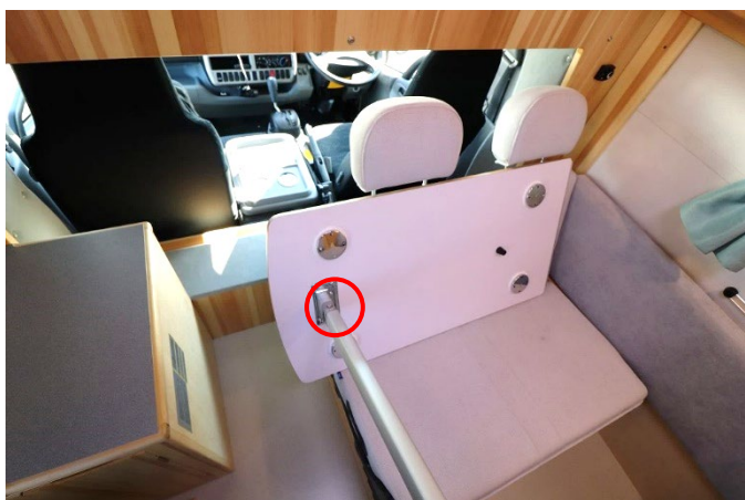
ボタンを押してロックを解除し、足を折りたたみます。