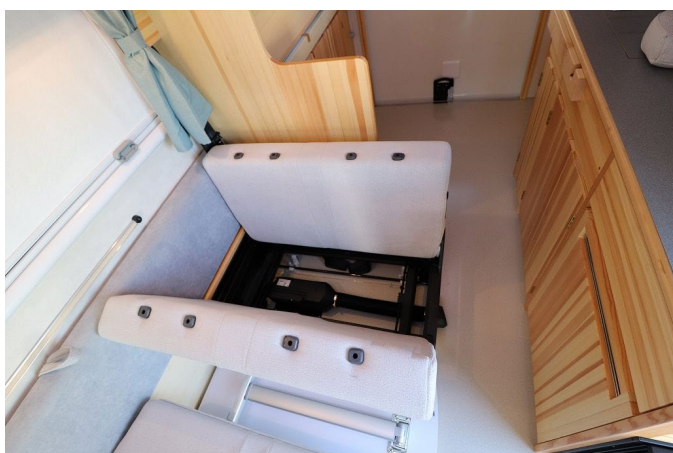
座面を反転して背もたれを前に倒します