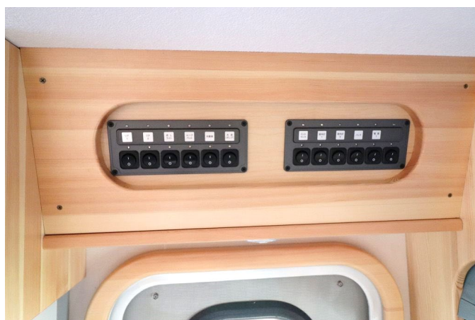
照明、冷蔵庫、水道ポンプなどのスイッチ