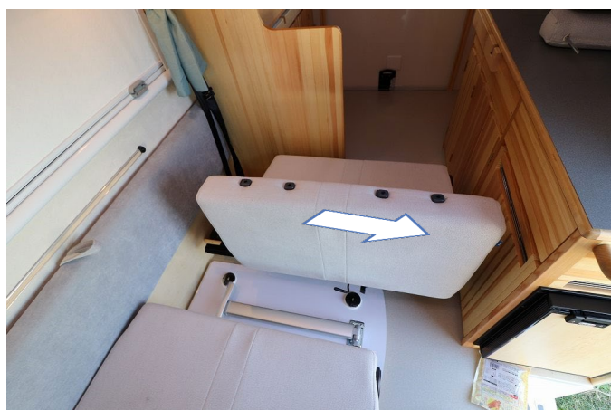
ベッドのままでは動かしにくいので座面を一度上げてから動かします。