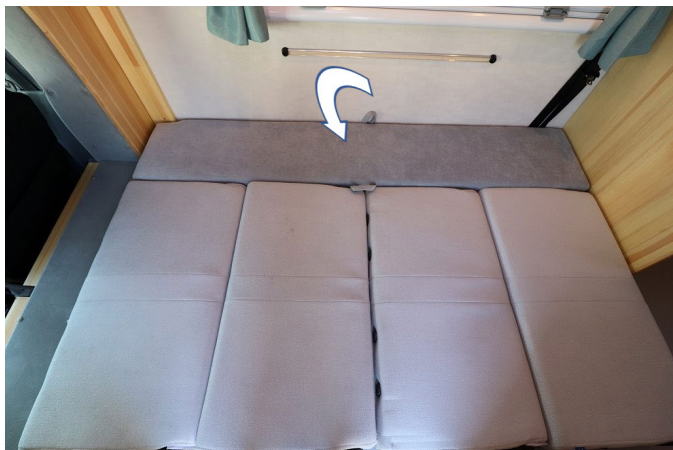
間にサイドマットを置いて2人分のベッド完成