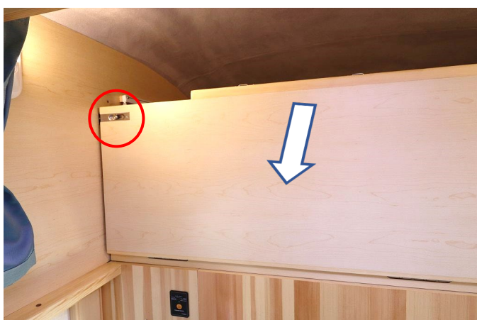
ロックを解除し板を開きます